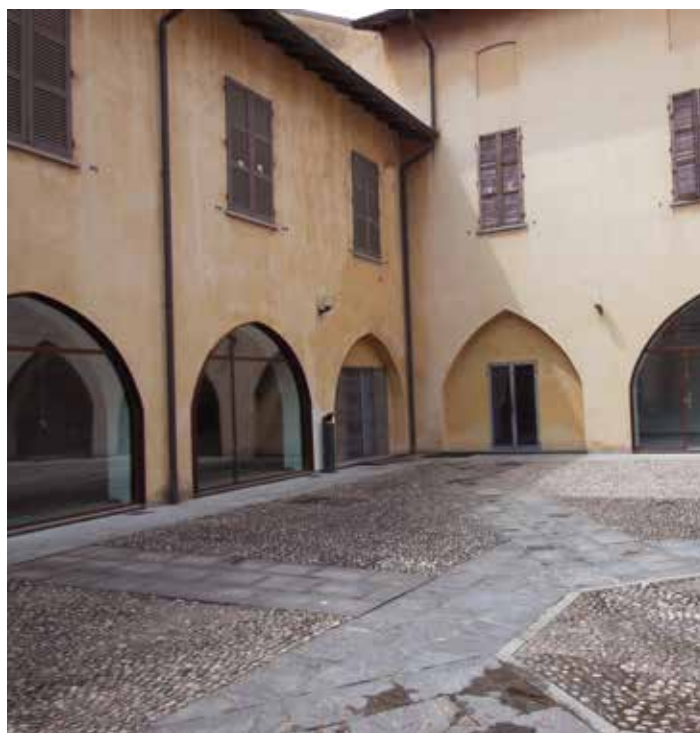
Casa della Cultura