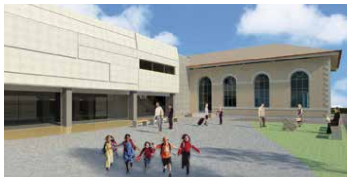
Progetto nuova scuola dell'infanzia ex Umberto I

Per il Piano del Diritto allo Studio, il Comune conferma il suo impegno per la realizzazione della didattica digitale nelle scuole con l'acquisto del materiale informatico necessario e per le esperienze degli studenti con l'Alternanza Scuola-Lavoro nelle scuole superiori.