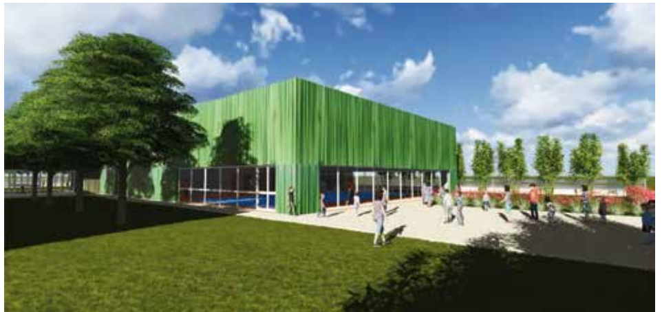
Progetto nuova scuola primaria

Da quest'anno il bilancio cambia per tutti i Comuni italiani con l'applicazione della nuova legge, con la quale viene introdotta una normativa più stringente che richiede il controllo costante delle entrate e quindi ogni criticità derivante dal mancato pagamento di tasse e tariffe potrebbe creare difficoltà al bilancio del Comune. Non aiuta certamente la situazione economica generale del Paese ed è noto a tutti come i Comuni siano comunque chiamati a concorrere al risanamento