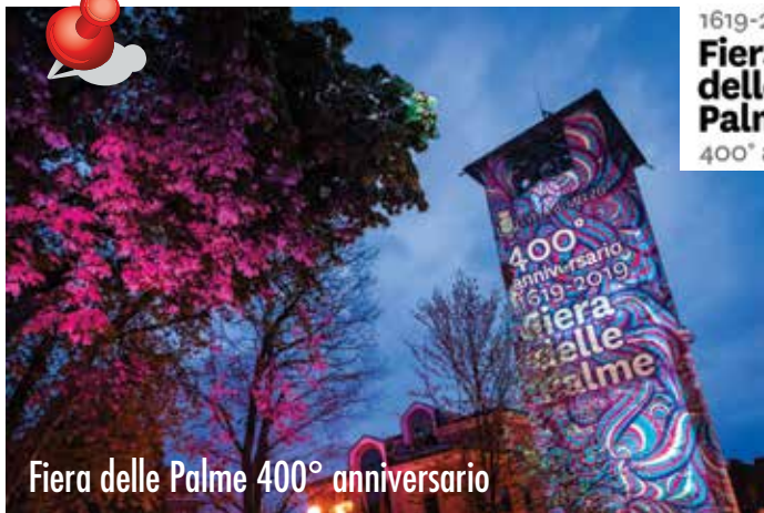
Fiera delle Palme 400° anniversario